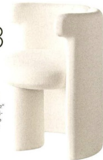
Sessel „Claudine“ von Meridiani, ab 2660 €