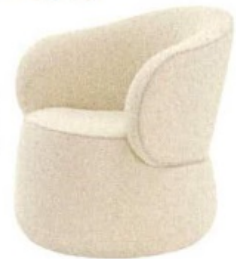
Sessel „Bun“ von Wittmann, ab 3550 €